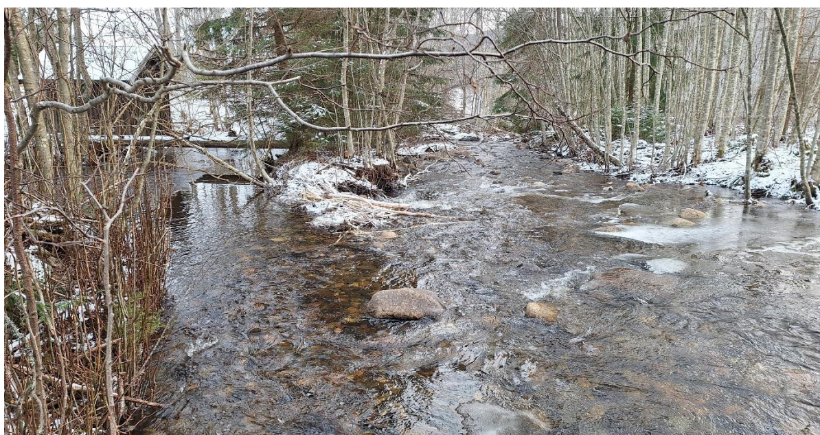
Figur 4. Vanninntak fra Moselva, samt spor etter beveraktivitet.

Resterende befart strekning i Moselva bærer preg av stor og naturlig variasjon i både substrat og kantvegetasjon. Strekingen er lite negativt påvirket av menneskelige inngrep, selv om det er et vanninntak (fig. 4) og det som ser ut som rester etter en gammel dam (fig. 5).