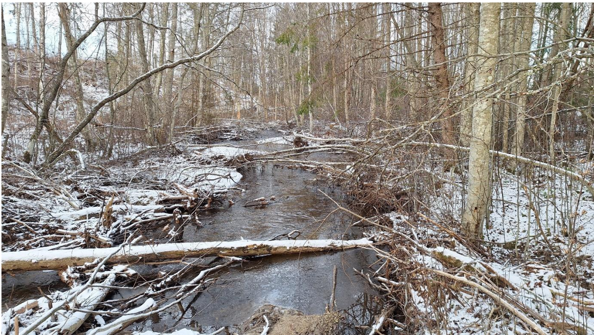
Figur 6. Naturlig elveutvikling med variert strømningsmønster, forskjellige substrat og mye død og levende ved i vassdraget.

Kantsonen er rik, og elva er forsynt med mye både død og levende ved. Dette medfører noe oppstuvning i noen områder, samt at elva har tatt noen nye løp, men dette er en naturlig elveutvikling som er ønsket i områder hvor elva har mulighet til det (fig. 6).