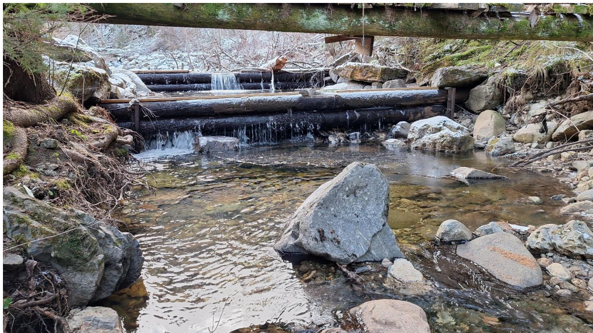
Figur 2. Sedimentasjonsdam i Svenåa utgjør et vandringshinder for blant annet fisk. På de fleste vannføringer er dette en fullstendig vandringsbarriere (altså at den er helt upasserbar).

I Svenåa utgjør sedimentasjonsdammen nedstrøms motorvegen et vandringshinder for fisk (fig. 2).