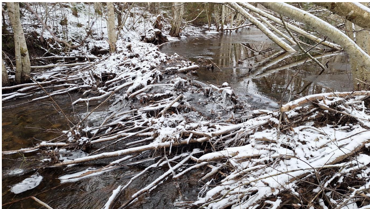
Figur 7. Oppstuvning i Moselva. Denne kvistterskelen skyldes sannsynligvis delvis beveraktivitet. Slike dammer er ofte passerbare for fisk.

Det var ferske spor fra beveraktivitet i områder, noe som også kan bidra med noe oppdemming. Dette kan medføre problemer for fiskevandring osv, men det er også påvist at fisk i stor grad klarer å passere gjennom/forbi oppstuede kvistterskler og beverdemninger. I Moselva ser det ikke ut til at oppstuvninger og beveraktivitet medfører betydelige hindringer for fiskevandring (fig. 7).