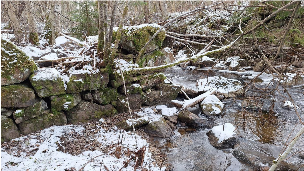
Figur 5. Eldre steinkonstruksjon ut mot elva.

Kantsonen er rik, og elva er forsynt med mye både død og levende ved. Dette medfører noe oppstuvning i noen områder, samt at elva har tatt noen nye løp, men dette er en naturlig elveutvikling som er ønsket i områder hvor elva har mulighet til det (fig. 6).