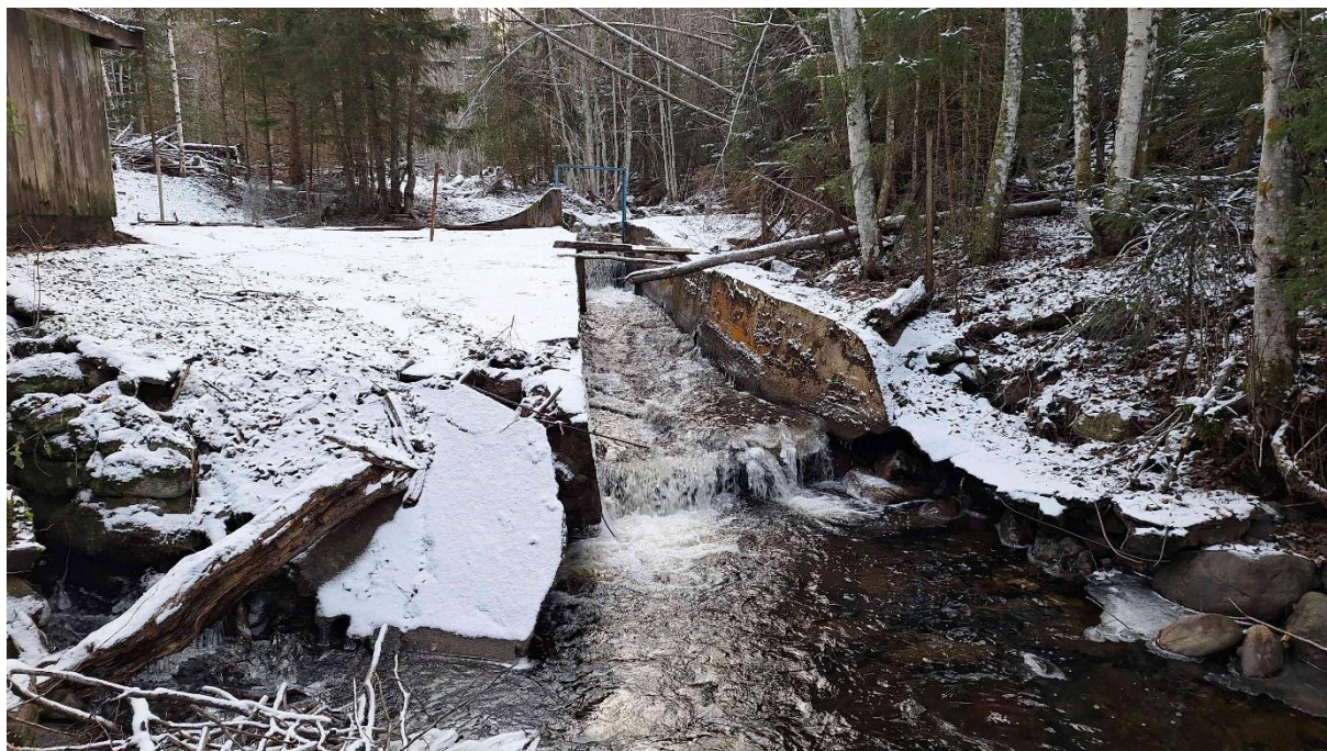
Figur 3. Sannsynlig vandringsbarriere i Moselva. Øverst i renna er det et sprang på ca 1 meter, bygd opp av impregnerte bord satt på tvers i metallramme.

Dersom denne konstruksjonen ikke lenger har en funksjon, burde den saneres. I påvente av det burde de impregnerte bordene som utgjør selve fallet fjernes. Dersom anlegget har sesongmessig funksjon, burde vannet kunne renne fritt i de periodene der anlegget ikke benyttes.