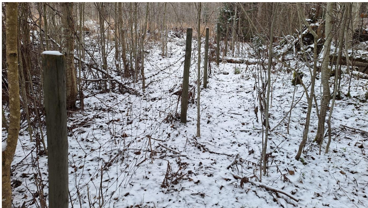
Figur 8. To eksempler på gjerder langs elva. Noen har piggråd, mens mange ikke har det. Felles for de fleste er at de delvis ligger nede over korte eller lengre strekninger.

Av øvrige observasjoner knyttet til vassdraget bør det nevnes at det var otterspor på hele strekningen. Minkspor ble også observert, først og fremst i de nedre delene. Førstnevnte er en naturlig art i området som er på fremmarsj igjen i våre områder etter å ha vært nærmest borte blant annet på grunn av høyt jakttrykk i forrige århundre. Sistnevnte er en innført og svartelistet art som kan gjøre stor skade på naturlige fiske-, pattedyr- og fuglebestander.